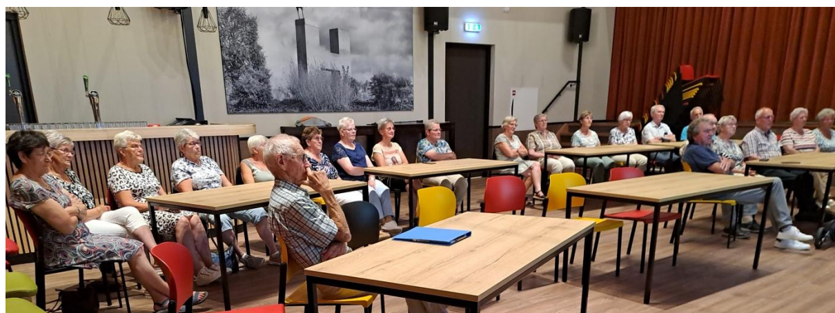
Aandachtig gehoor tijdens presentatie Buurtzorghuis Hospice Doevenbos