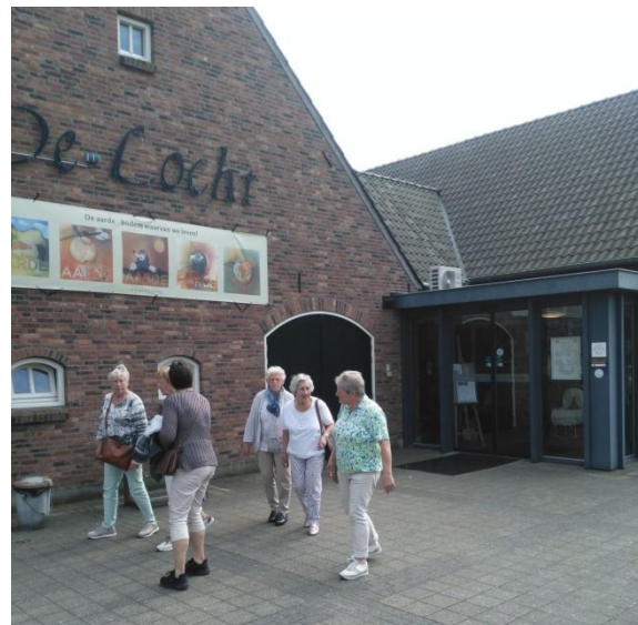
Tussenstop in Openluchtmuseum De Locht in Melderslo