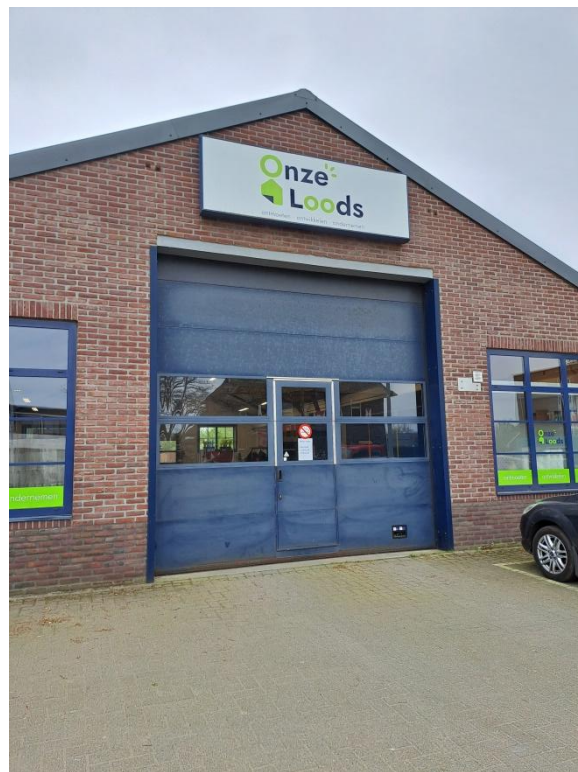
Locatie Onze Loods in Horst aan de Venloseweg 22-24

Onze Loods heeft ook een Dienstencentrum. De diensten zijn bedoeld voor mensen die dat zelf niet meer zo goed kunnen. De werkzaamheden worden uitgevoerd door deelnemers die werkzaam zijn bij Onze Loods door middel van een werkervaringstraject of dagbesteding. Zij worden begeleid door werkbegeleiders en vrijwilligers van Rendiz. Het dienstenaanbod betreft tuinonderhoud, kleine klussen in huis, opruimen of andere klussen op aanvraag.