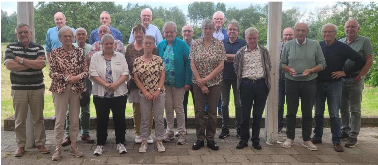
Afgevaardigden van de Seniorenverenigingen in Horst aan de Maas tijdens oprichtingsvergadering Senioren Netwerk Horst aan de Maas in Meerlo