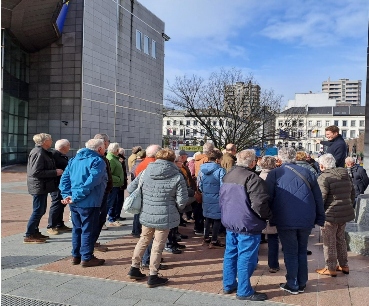
Welkomstwoord door Jurian van den Camp, Parlementair medewerker van Jeroen Lenaers bij de ingang van het Europees Parlement