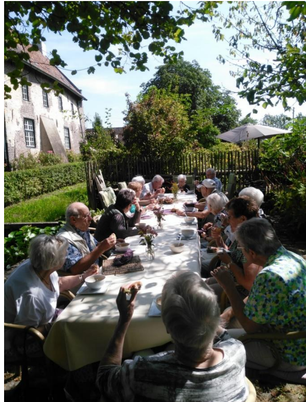
Lunchpauze bij Huys Kaldenbroeck in Lottum