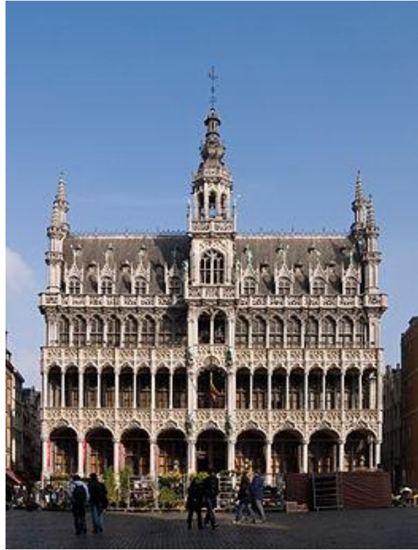
Bezoek onder leiding van een gids aan de Grote Markt in Brussel met het