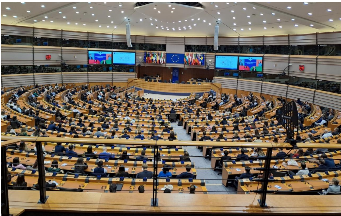
Plenaire vergaderzaal Europees Parlement Brussel